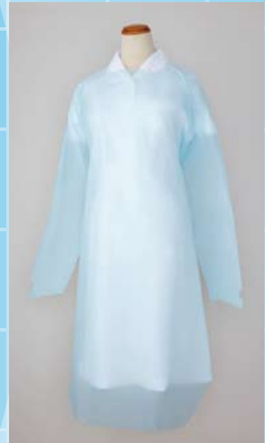
※写真は親指フックタイプです。