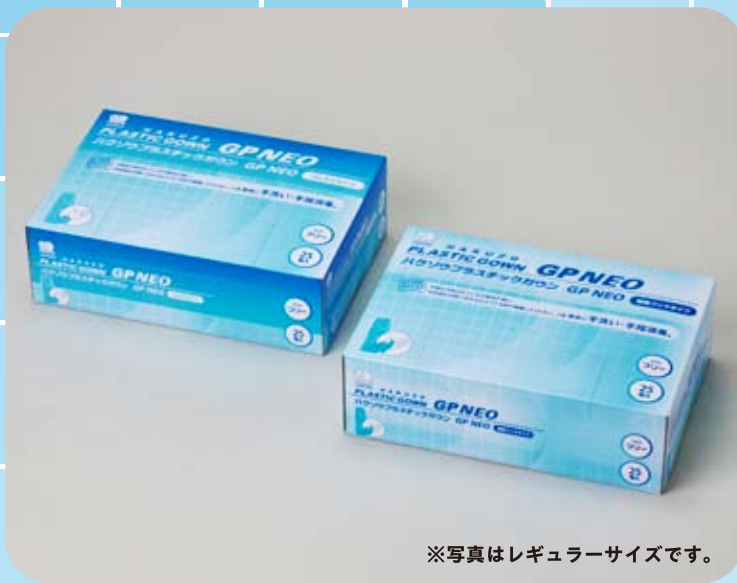
※写真はレギュラーサイズです。

血液・体液・排泄物などから医療従事者を保護するための袖付ディスポーザブルエプロンです。